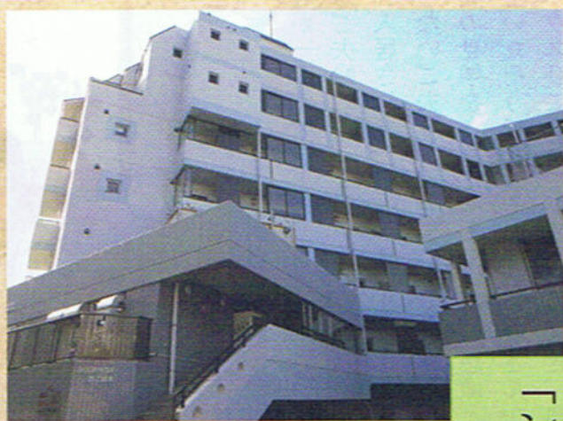
中央タクシー(有)・(株)フマニ との一体型の建物です

長崎港を一望できるロケーション 1,000万ドルの 夜景も独占め 全室、南～南西向き 日当たりも良好 自家用車がなくてもタクシー・定期バスで中心街まで アクセスもスムーズ 体験入居も随時、受付け中 会員は1泊2食2,100円です