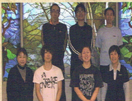
2月某日の介護スタッフです。ご利用者との共同体を作るという理念の下、日々精進しています。

スタッフは、介護職員と看護職員で20人、生活相談員、ケアマネ各1人、栄養士1人です。